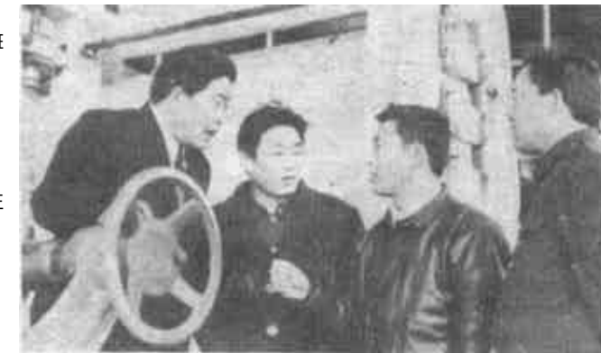
大王的风采,大王的发展,离不开大王的带头人。图为镇领导深入企业调查研究。