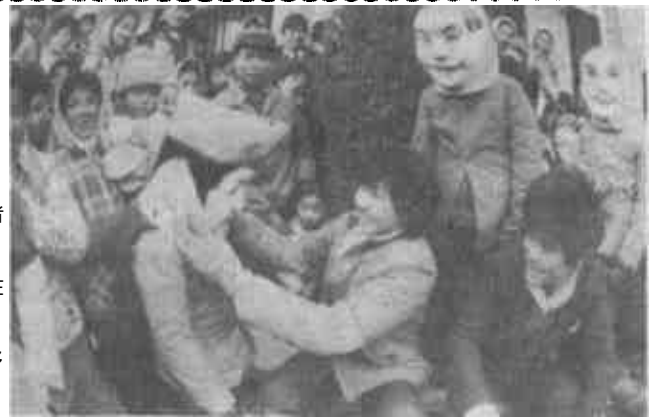
能歌善舞的大王人,逢年过节总要在街上亮亮相。